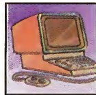
حَاسُوبٌ ( كُمبِيوتَر )